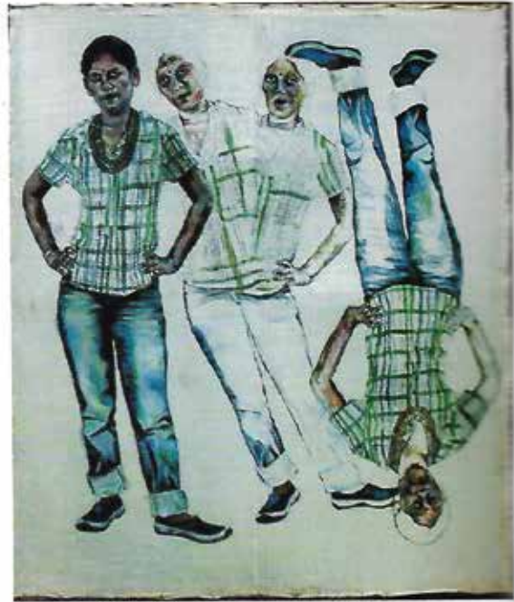
Swamaly Mitra Rini 201. Game -1 Oil on Canvass