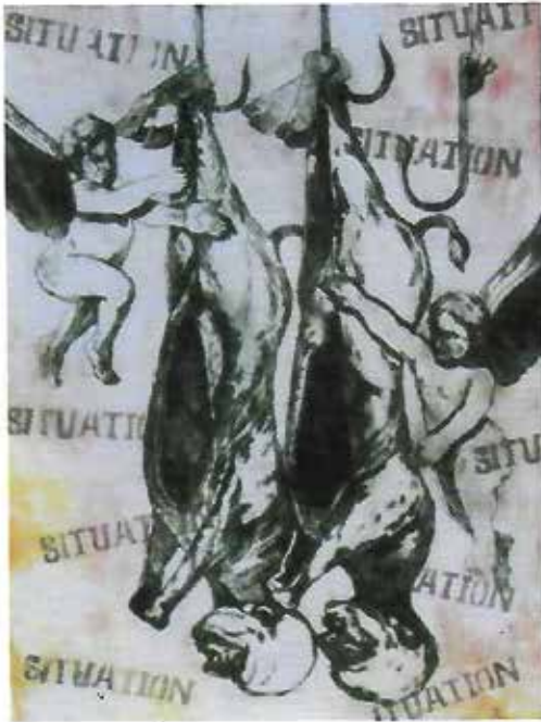
Monjur Ahmed 88. Situation-2 Mixed Media in Print