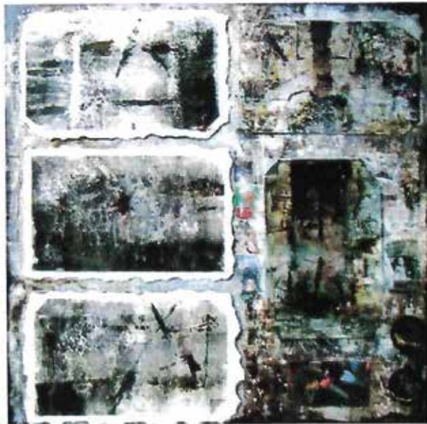
Md. Abdus Sobahan Hira 138. Life Circle-2 Mixed Media